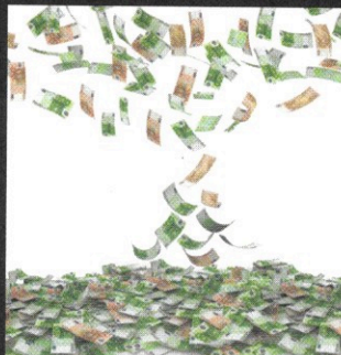
So sieht sie die Pharmaindustrie