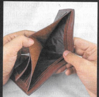
So sehen sie die Schanigärten